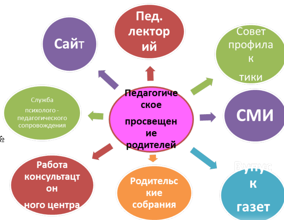
Рисунок 1. Формы работы

В системе повышения педагогической культуры родителей в школе используются разнообразные формы работы (рисунок 1).